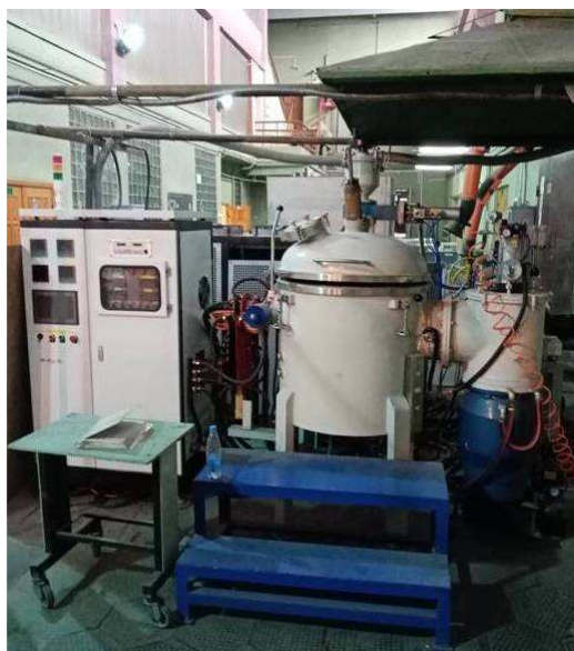
Рисунок 1 – Вакуумная 10-килограммовая индукционная плавильная установка фирмы Zhengzhou Brother Furnace Co. Ltd

В большинстве случаев ВЭС получают путем плавления материалов с последующей их кристаллизацией в вакууме с применением индукционного нагрева [6]. При этом, с целью повышения степени однородности отливок, их переплавляют несколько раз. Слитки, полученные в вакуумной печи, деформируют прокаткой, после чего они готовы для наплавки на композиционную подложку. В результате получаемый материал обладает высокой твердостью, прочностью, износостойкостью [7], характеризуется повышенной пластичностью при низких температурах, коррозионной стойкостью, термической стабильностью [10], устойчивостью к ионизирующим излучениям, которые улучшают поверхностные характеристики деталей из литых композиционных материалов.