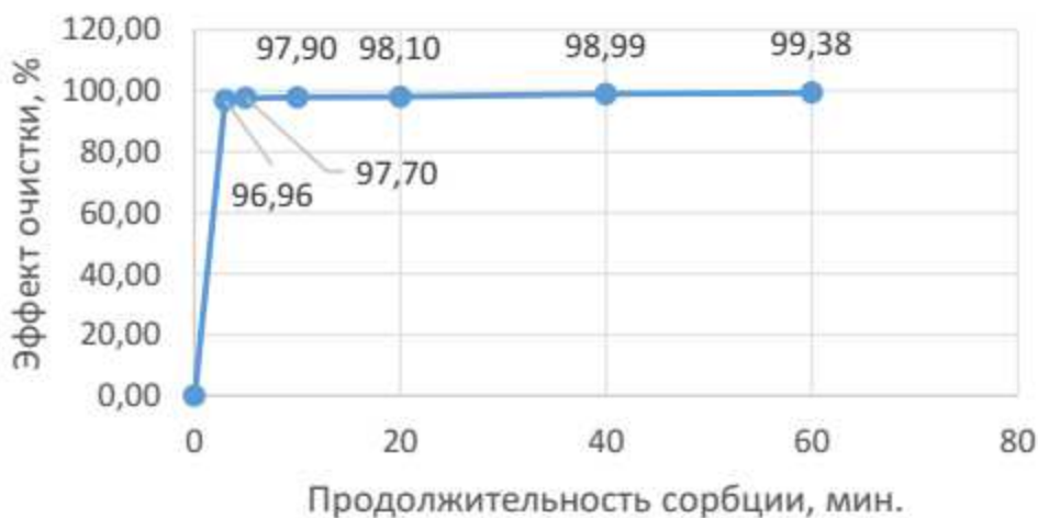
Рисунок 1 – Зависимость эффекта сорбции ионов Pb^{+2} от продолжительности контакта

где C_1, C_2 – соответственно? массовая концентрация ионов до и после опыта.