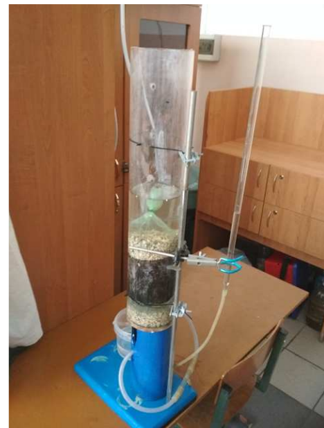
Рисунок 3 – Общий вид установки для исследования сорбционной емкости брикетированного торфа в динамических условиях