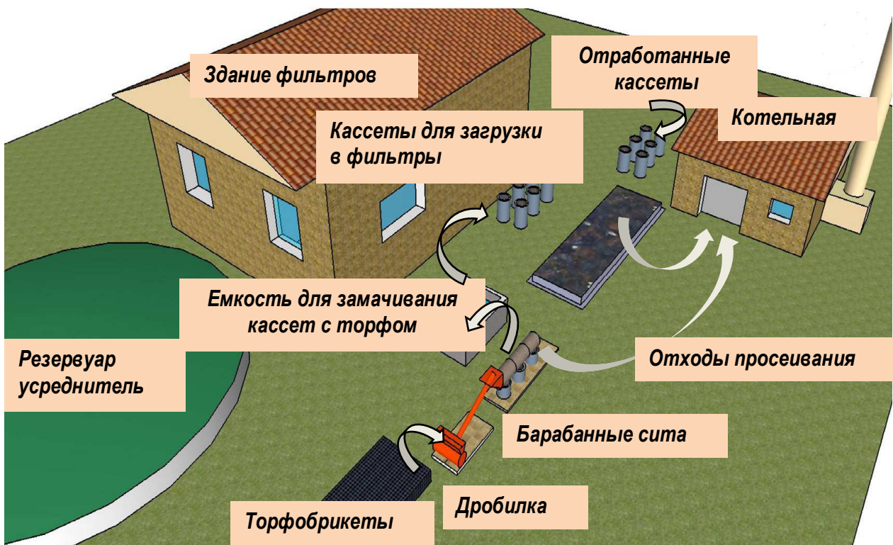
Рисунок 4 – Технология очистки воды от ионов свинца гранулами из брикетированного торфа