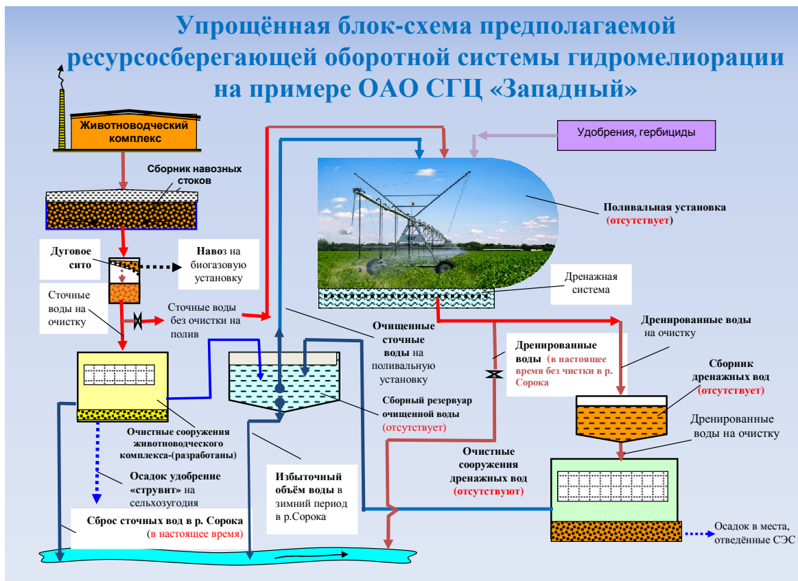
Рисунок 2 – Блок-схема ресурсосберегающей оборотной системы

тенденцию к расширению. Полученные с этих земель корма и другая сельскохозяйственная продукция отличаются высоким содержанием нитратов и по санитарно-гигиеническим нормам являются непригодными для их использования [2].