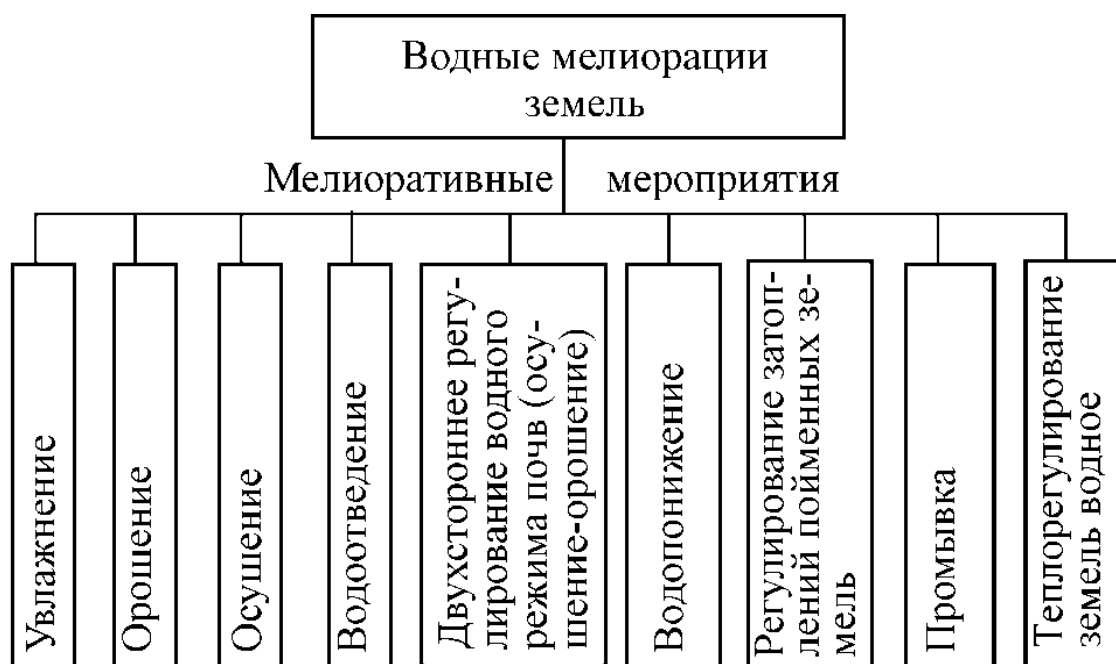
Рисунок 1 – Классификация водных мелиораций земель по мероприятиям

Классификация существующих систем водной мелиорации земель приведена на рисунке 1, а предполагаемая упрощенная блок-схема ресурсосберегающей оборотной системы гидромелиорации на ОАО СПЦ «Западный» – на рисунке 2.