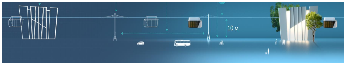
Рисунок 1 – Визуализация транспортно-инфраструктурного решения uST [9]

Новизна решений uST заключается в том, что транспортно-инфраструктурные объекты комплекса размещены на «втором уровне» с применением комплексных подходов к минимизации энерго- и ресурсозатрат для его функционирования и повышению экологичности. Инновационность применяемых технологий заключается в конструктивных особенностях рельсовых электромобилей, предварительно напряжённых путевых структур и АСУ на основе технологий искусственного интеллекта. Визуализация uST в экосистеме (жизнедеятельности человека) представлена в виде рисунка 1.