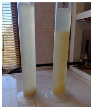
Рисунок 2 – Сточная вода: pH – 5,8 и pH – 9,5 (коагуляции через 15 мин.)

В тузлуке процесс хлопьеобразования идет быстрее, хлопья более крупные (Рисунок 3, 4). На предприятии тузлук, по мере накопления емкостей, дозируется в смеситель без добавления реагентов, после удаления на сите грубодисперсных примесей.