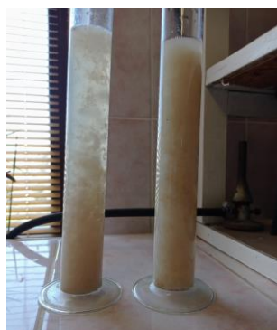
Рисунок 3 – Тузлук: pH – 5,2 и pH – 9,5 (начало коагуляции)

Химические процессы, происходящие при обработке воды коагулянтами, перевода коллоиды из растворенного в труднорастворимое состояние, позволяют на следующих этапах очистки удалить их более простыми физико-механическими способами, например в центрифуге.