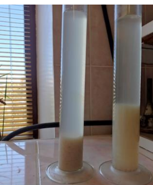
Рисунок 4 – Тузлук: pH – 5,2 и pH – 9,5 (через 15 мин.)