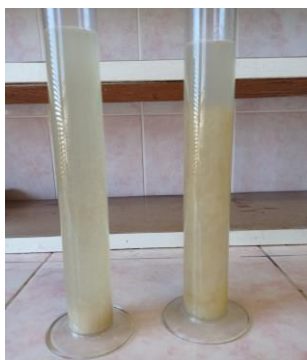
Рисунок 1 – Сточная вода: pH – 5,8 и pH – 9,5 (начало коагуляции через 5 мин.)

сбора тузлука. Предварительно в исследуемой воде определяли значение pH и подщелачивали до pH = 7 и 9,5. При pH = 9,5 процессы хлопьеобразования и седиментации идут интенсивнее (Рисунок 1, 2).