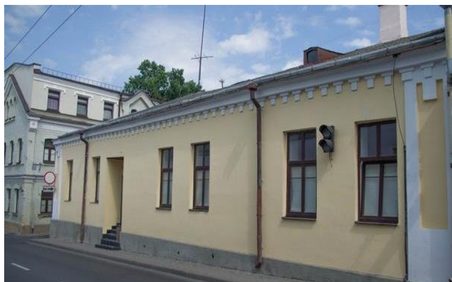
Рисунок 6 – Общий вид фасада по ул. Кирова

Цель исследований здания тюрьмы № 1 – изучение технологических особенностей нанесения исходных штукатурных растворов, определение первоначальных окрасочных составов и разработка методических рекомендаций по проведению ремонтно-реставрационных работ на фасадах здания.