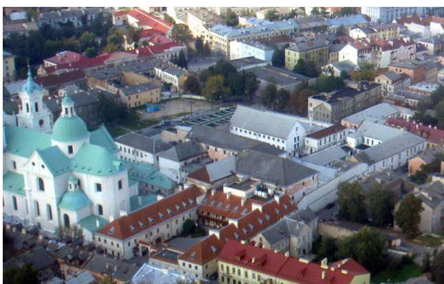
Рисунок 4 – Фото тюрьмы, 2006 г.