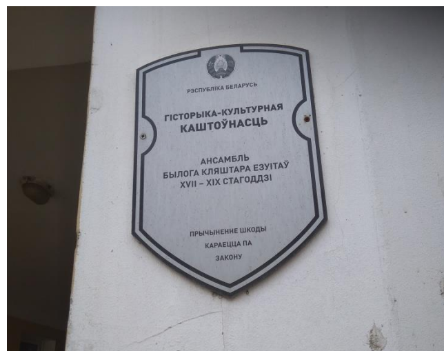
Рисунок 5 – Охранная доска на здании тюрьмы № 1 в г. Гродно

В разделе КНИ авторами были проведены физико-химические исследования строительных растворов и окрасочных составов фасадов здания тюрьмы № 1 в г. Гродно. Общий вид фасада по ул. Кирова представлен на рисунке 6. Общий вид фасада по ул. Городничанской представлен на рисунке 7. При отборе образцов для проведения исследований производилась фотофиксация мест отбора на фасадах здания.