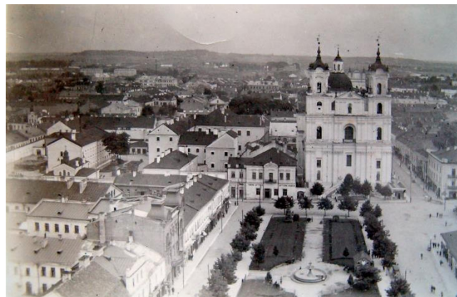
Рисунок 1 – Фото тюрьмы, начало XX в.

Гродненская тюрьма появилась в непростое время. Весь XIX век губернию лихорадило: войны, восстания и, как результат, тяжелое экономическое положение ухудшили криминогенную обстановку. Преступников становилось все больше и больше. Поэтому тюремный замок был обречен на постоянное расширение. Здания бывшего коллегиума один за другим переоборудовались под тюремные нужды. Ученым удалось добраться до плана 1839 года. Согласно ему на территории замка с левой и правой стороны от входа посадили деревья, разбили небольшие огороды, а здание бывшей кузницы стали использовать под пекарню. Но и этого не хватало. В 1883 году за чертой города был выделен участок для строительства новой тюрьмы на 300 человек. Планы нарушил страшный пожар 1885 года. Тогда сгорела фактически вся центральная часть города. Каменные постройки тюремного замка уцелели. Строительство новой тюрьмы снова было отложено. Через несколько лет гродненская тюрьма по количеству заключенных стала одной из самых больших на северо-западе России. Тем не менее в XX век тюрьма вступила обновленной. Появилась женская больница, баня, прачечная, церковь, звонница, сарай, морг, полы во всех помещениях заменили на деревянные, а деревянные ступени, наоборот, заменили на гранитные (рисунок 1).