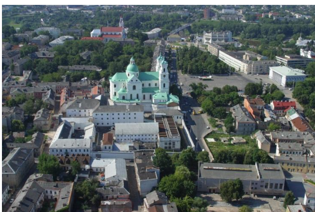
Рисунок 3 – Фото тюрьмы, общий вид, 2004 г.

Из архивной исторической справки: «Кірава № 1 — Былы езуіцкі калегіум, турма. Пасля няўдачы першай спробы заснаваць у Гродне езуіцкі калегіум (гл. раздзел аб Замкавай вуліцы) езуіты ізноў з'явіліся ў горадзе ў 1622 г. і пасяліліся ў купленай камяніцы на рынку (магчыма «Замкавым двары»). Дзякуючы шэрагу фундацый езуітам удалося купіць шэраг пляцаў на ўсходнім баку Рынка, вуліц Калючынскай і Рэзніцкай. У 1637 г. езуіты купляць зван для невялікага касцёла, а сейм 1647 г. пацвярджае іх валоданне пляцамі, на якіх павінен быць узведзены калегіум. Магчыма будаўніцтва новага касцёла пачалося ці было падрыхтавана, аднак маскоўская навала перарвала гэтыя працы. У 1666 – 1667 гг. згадваецца аб будаўніцтве новага прэзбітэрыума, аднак прэзбітэрыум быў драўлянага касцёла св. Пятра і Паўла, а не мураванага Францішка Ксаверыя.