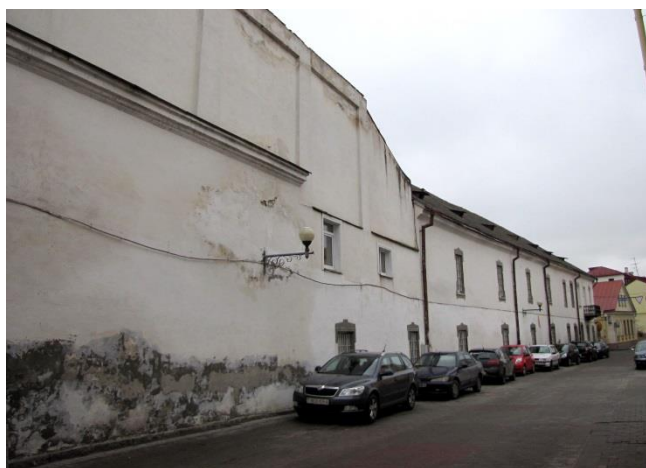
Рисунок 7 – Общий фасада по ул. Городничанской

Цвета лакокрасочных покрытий и отделочных составов указаны по каталогу «3D-plus» компании CAPAROL, применяемые в настоящее время архитекторами-реставраторами в Республике Беларусь. Цвет покрытия определялся путём визуального сравнения образца с эталонной типографской выкраской. Для устранения метамерии определение цвета проводилось при рассеянном естественном освещении [8, 14].