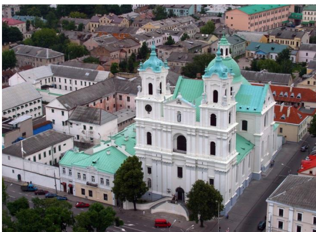
Рисунок 2 – Фото тюрьмы с воздушного шара, 2004 г.

Из архивной исторической справки: «Кірава № 1 — Былы езуіцкі калегіум, турма. Пасля няўдачы першай спробы заснаваць у Гродне езуіцкі калегіум (гл. раздзел аб Замкавай вуліцы) езуіты ізноў з'явіліся ў горадзе ў 1622 г. і пасяліліся ў купленай камяніцы на рынку (магчыма «Замкавым двары»). Дзякуючы шэрагу фундацый езуітам удалося купіць шэраг пляцаў на ўсходнім баку Рынка, вуліц Калючынскай і Рэзніцкай. У 1637 г. езуіты купляць зван для невялікага касцёла, а сейм 1647 г. пацвярджае іх валоданне пляцамі, на якіх павінен быць узведзены калегіум. Магчыма будаўніцтва новага касцёла пачалося ці было падрыхтавана, аднак маскоўская навала перарвала гэтыя працы. У 1666 – 1667 гг. згадваецца аб будаўніцтве новага прэзбітэрыума, аднак прэзбітэрыум быў драўлянага касцёла св. Пятра і Паўла, а не мураванага Францішка Ксаверыя.