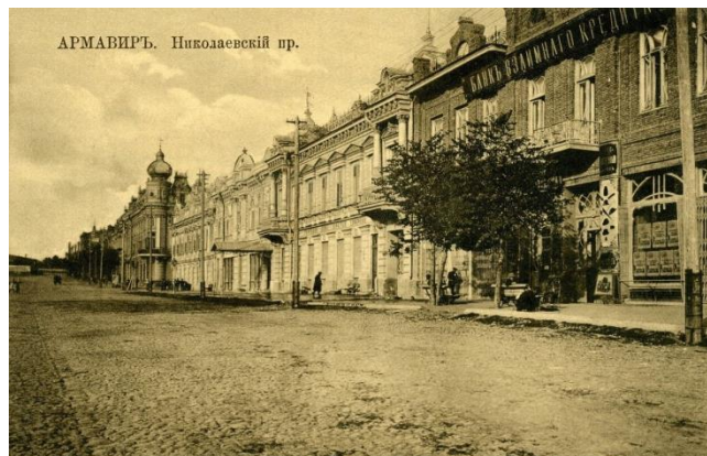
Рисунок 3 — Армавир. Фронтальная застройка исторического квартала. Западная сторона Николаевского проспекта от ул. Бульварной на юг, 1913 г. [3]