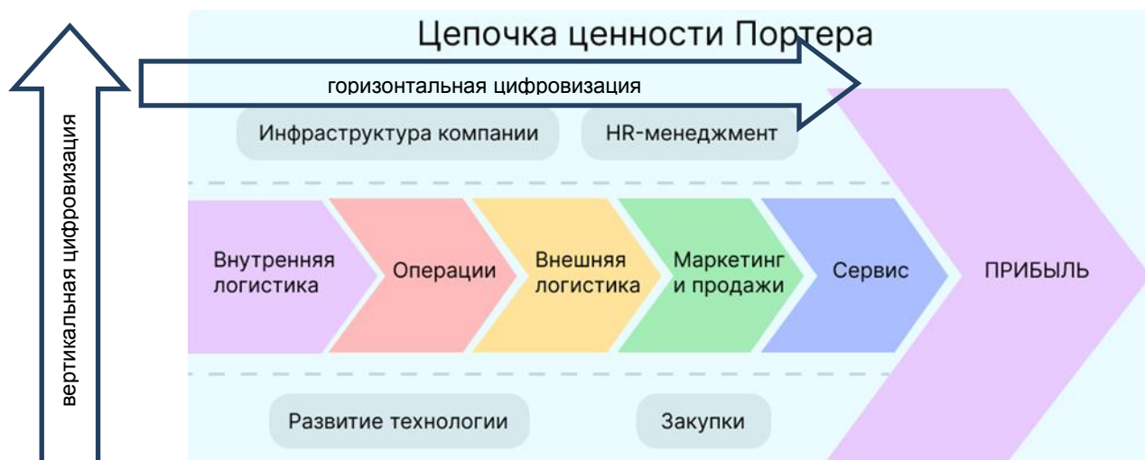
Рисунок 3 – Модель цифровизации по цепочке ценностей

Обоснованный выше концептуальный подход позволил идентифицировать горизонтальную и вертикальную цифровизацию (рисунок 3).